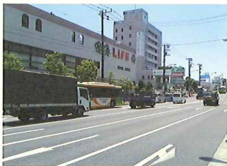
スーパー・ホームセンター