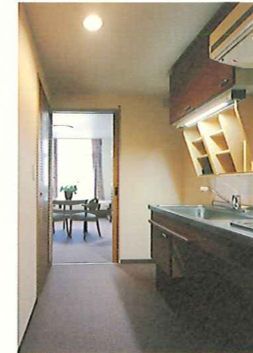
車イス用キッチン