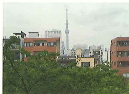
スカイツリー(六華園3階北側居室から)